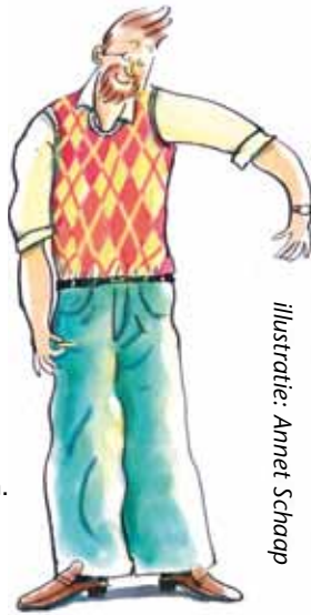
Illustratie: Annet Schaap

Je bent als leerkracht een belangrijk rolmodel. Schrijf op wat de kinderen je vertellen, zodat je het kunt onthouden en later nog eens kunt voorlezen. Maak lijstjes, bijvoorbeeld van kinderen die 's middags nog een opdracht moeten afmaken. Schrijf een verslagje van de dag voor je duo-collega. Creëer situaties die kinderen aanzetten tot schrijven. Laat ze een verhaaltje bij hun tekening bedenken en laat ze dat er bij krabbelen of schrijven. Verander de routine eens op maandagochtend: kinderen vinden het ook leuk om te tekenen en te schrijven over het weekend, in plaats van te vertellen wat ze gedaan hebben.