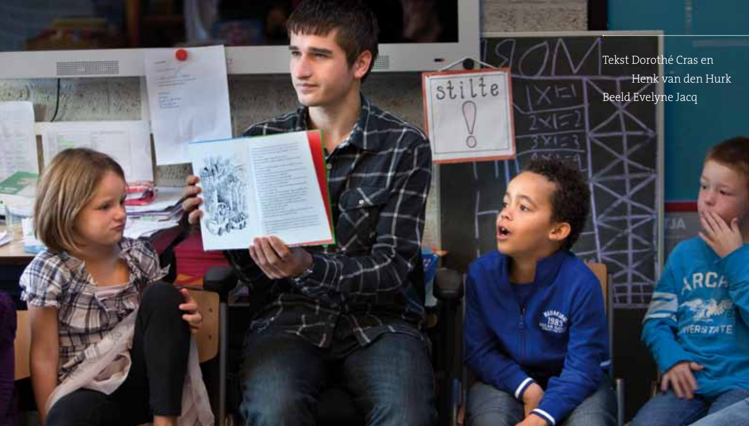
Pabo-studenten worden tijdens het voorlezen gericht geobserveerd: hoe is hun instructiegedrag, hoeveel kinderen letten er op?

vast te stellen. Het eerste jaar wordt gekeken naar voorbereidend, het tweede jaar naar aanvankelijk- en voortgezet lezen en het derde jaar naar het omgaan met verschillen tussen leerlingen. Na afloop worden de observatiegegevens digitaal verwerkt.