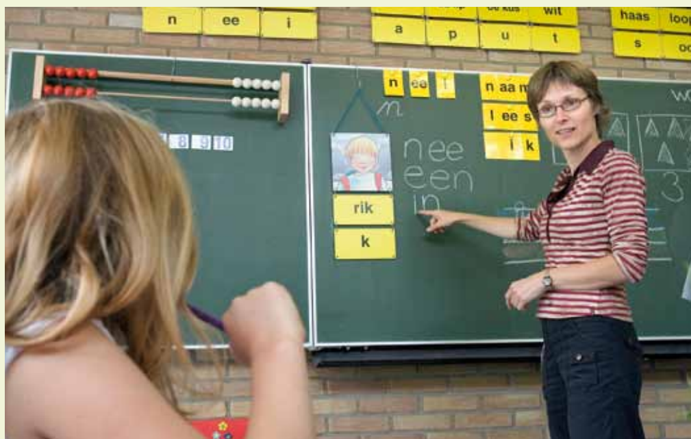
Leerkrachten kunnen hulp gebruiken bij het werken met de referentieniveaus.

NOOIT een A-leerling.' En Feline (25 jaar, groep 4/5) zegt: 'Je weet dat een leerling het eigenlijk niet kan. Zulke leerlingen zijn er gewoon, door allerlei redenen kunnen die het niet.' De leerkrachten lijken zich er zelfs bij neer te leggen dat bepaalde groepen leerlingen in bepaalde wijken nooit goed zullen presteren. Annie (55 jaar, groep 3) verwoordt