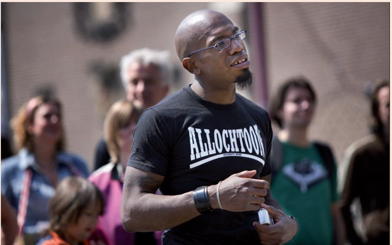
Het gezicht van kosmopool Nederland is de afgelopen decennia veranderd, de grote steden zijn van kleur verschrompelen.

Er zijn veel zaken die ons vermoeien in het huidige tijdsgewricht. Soms denk ik wel eens dat wat de politiek heeft gedaan met het onderwijs, of wat het onderwijs met zich heeft laten doen, heeft geleid tot een structurele vermoeidheid. Wat onder andere zo vermoeiend is, is de hype-cultuur. Dat