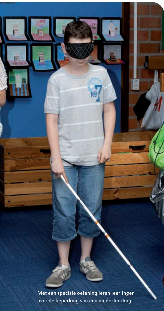
Met een speciale oefening leren leerlingen over de beperking van een medeleerling.

'Leerlingen zonder beperking vragen soms veel meer tijd'