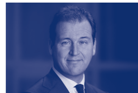
Lodewijk Asscher Minister van Sociale Zaken en Werkgelegenheid

Gedachten vormen en verwoorden zijn onmisbare vaardigheden in onze open, vrije samenleving. Goed onderwijs laat leerlingen daarom niet alleen leren maar ook denken. Als docent heb je hier een belangrijke rol