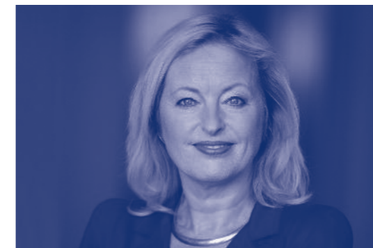
Jet Bussemaker Minister van Onderwijs, Cultuur en Wetenschap